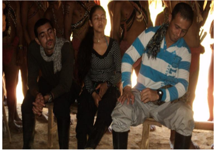
Cansado de escuchar hablando la voz de Comunidad