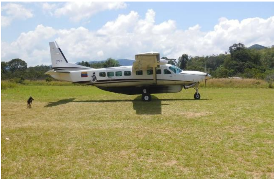
Momento en que el Grupo Aéreo de Transporte N°9 se lo llevan para Ciudad Bolívar para las averiguaciones e investigaciones.