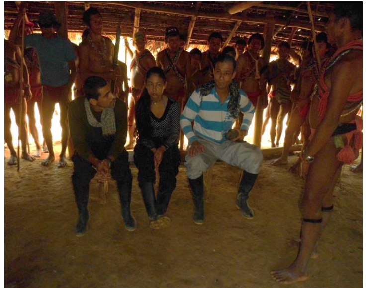
Momentos en que los tres "GUERRILLEROS" piensan como responder las preguntas hechas por el jefe general, es donde comienza a mentir que supuestamente envió el presidente de la República Bolivariana de Venezuela Nicolás Maduro Moros